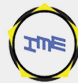
بورس کالای ایران